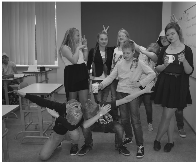
Tekst Marleen Paist ja foto Helina Hansar

Juba esimesest klassist peale on minul olnud õpetajate päeval väike põnevus sees. Suur ootus, kes on minu uus õpetaja? Millised näevad välja tunnid? Kuidas 12. klassi õpilased hakkama saavad? Nüüd abituriendina ütlen, et tegemist on suure-suure ettevalmistusega. Oli vaja mõelda, et iga klassi ees oleks õpetaja, tundidel oleks mingi sisu, õpilasetel ja õpetajatel oleks huvitav päev, aktus õnnestuks ja õpetajatel oleks tort päeva lõpus laual. Nende ettevalmistustega saime tunda õpetajate enam-vähem igapäevast tööpäeva. Õpetajate päev õnnestus meie jaoks ilma probleemideta. Meie olime päeva lõpus õnnelikud ja rahul. Ma loodan, et seda sama tundsid ka meie kaasõpilased ja õpetajad.